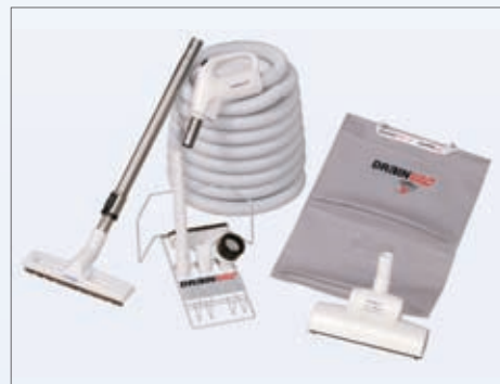
Osnovni kit sa dubinskom četkom