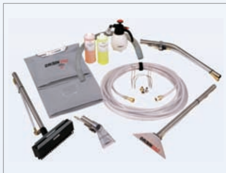
Kit za čišćenje za profesionalnu upotrebu

VACSI CENTRALNI USISNI SISTEMI D.O.O. DONJA MUTNICA BB 35255 DONJA MUTNICA PARAĆIN SRBIJA WWW.VACSI-SRBIJA.COM